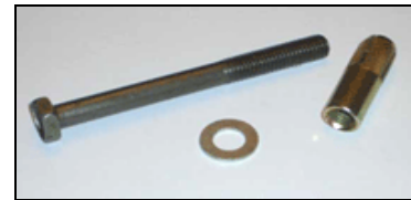
FIXSAFE – Befestigungselemente für Beton