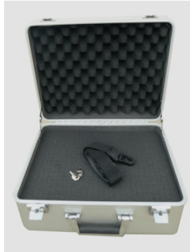
Innen-Einteilung - Würfelschaum