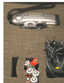
Würfelschaum / Beispiel f. Einteilung