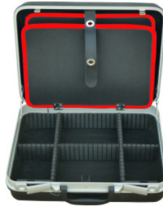
Innen-Einteilung - Trennwände + Werkzeugtafel