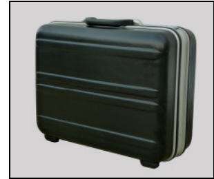
Transportkoffer ABS Kunststoff