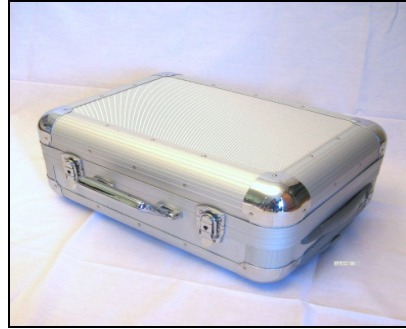
Transportkoffer Trolley aus Aluminium